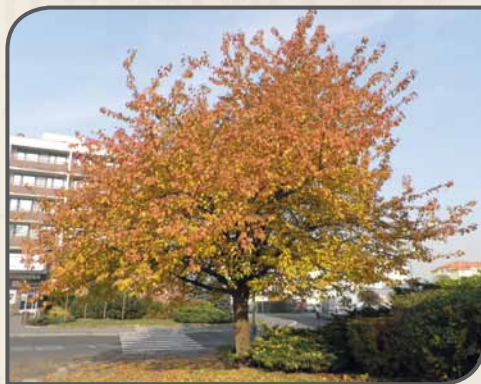
Třešeň ptačí u úřadu MČ Praha 15 v Horních Měcholupech

Stromy jsou nejvýraznější, nejkrásnější a nejdůležitější složkou městské přírody. Jsou to též největší a nejdéle žijící organismy ve městě. Žijí desítky i stovky let, a pokud je o ně dobře pečováno a přístupuje se k nim s určitou vážností, přežívají celé generace obyvatel.