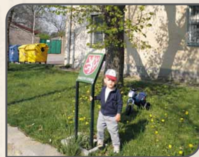
Označení památného stromu malým státním znakem u lípy u hasičské zbrojnice v Újezdu nad Lesy

• Významné stromy mohou být označovány jednotlivými obcemi, městskými částmi, v rámci činnosti spolků a dalších organizací.