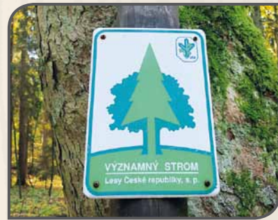
Na pozemcích Lesů České republiky jsou významné stromy označovány speciálními cedulemi