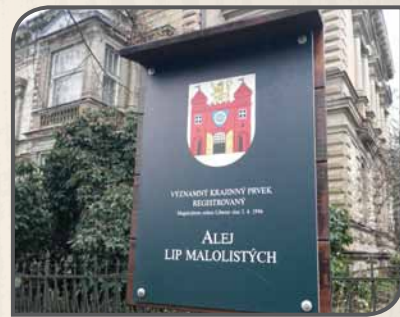
Zvýšená ochrana stromů může být zajištěna registrací jako významný krajinný prvek (fotografie ukazuje označení aleje v Liberci)