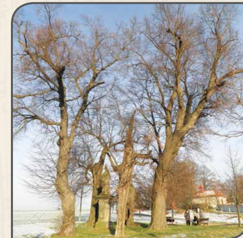
V pražských Kolovratech lemují do kruhu vysázené lípy barokní sochu sv. Donáta, kterou dala v roce 1756 zhotovit vévodkyně Marie Terezie Savojská.

V okolí našeho bydliště je celá řada zajímavých velikánů, kteří si zaslouží pozornost. Při jejich vyhledávání je nejlepší se nejprve zaměřit na jejich vzrůst a velikost. Ta je pro nás mnohdy signálem, že věkovitý strom toho mnoho pamatuje a může se k němu vázat řada zajímavých skutečností. Pozornost věnujeme hlavně soliterním jedincům a krajinným dominantám. Ty často bývají na důležitých bodech nebo místech nejrůznějších setkávání. Zájem je také účelné věnovat skupinám stromů u křížků, kapliček a dalších sakrálních staveb. U nich mohou být stromy vysazeny při založení, při následných rekonstrukcích či dalších důležitých událostech. Samostatným celkem jsou aleje, které mohou mít také značnou spojitost s historickými událostmi.