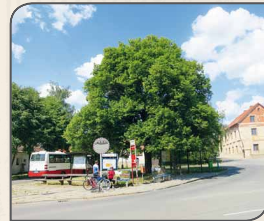
Významným stromem je bez pochyby i lípa rostoucí v Nebušicích. Je pozůstatkem původně čtyř lip, které byly vysazeny 10.5.1881 na počest sňatku korunního prince Rudolfa s její královskou výsostí belgickou princeznou Stefanií.

Pokud k některému stromu znáte historické souvislosti nebo pokud takové spojitosti naleznete, určitě si je nenechávejte pro sebe. Informace jsou vždy to nejčennější a jejich zprostředkování dalším osobám může zachránit zbytečně pokácený strom. V této souvislosti je nejlepší informovat místně příslušný