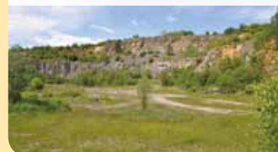
Nový bílý lom

Dalším lomem na trase je Nový Bílý lom. Jedná se o nejmladší lom v oblasti Damilu – těžba byla zahájena v roce 1952. Těžba zde byla ukončena podle plánu ve druhém čtvrtletí 1962 z důvodu otevření lomů Čertovy schody a Kosov. Jelikož jsou v předpolí lomu Českým