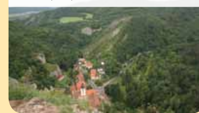
Pohled z vyhlídky U kříže

Zcela jistě se vyplatí vydat se vpravo vyhlídce U kříže. Ta nabízí nádherný pohled na obec Svatý Jan a na kaňon potoka Kačák. Za deštivého počasí je třeba zvýšené opatrnosti – vápence bývají velmi kluzké.