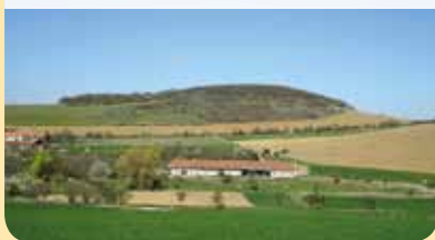
Vrch Bacín

Kousek pod vrcholem Bacína se nalézá úzká zkrasovělá vertikální puklina. Tato jeskyně má mimořádný archeologický význam. Na základě současných poznatků lze archeologické nálezy v tomto místě označit jako „kulturní fenomén“, který je ve střední Evropě