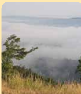
I mlhavé ráno na Zlatém koni má svůj půvab.

Od Koněpruských jeskyní vede trasa na vrchol Zlatého koně. Zde se návštěvníkovi nabídne nádherný rozhled do širokého okolí. Další kroky povedou na horní